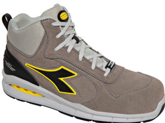
col.C8700 wind grey/wind grey

Chaussures de sécurité mi-hautes S3 en cuir suédé hydrofuge avec système de respiration latérale Net Breathing System by Geox. Embout en aluminium 200J. Chaussant 11. K SOLE, doublure en nylon résistante à l'abrasion et ultra respirante, semelle de propreté amovible, respirante et traitée aux charbons actifs.